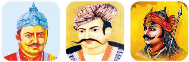
राजा नाहर सिंह राजा राव तुलाराम महाराणा प्रताप