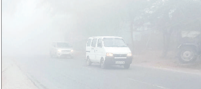
नारनौल। शुंभ में सड़क पर चलते वाहन।

आने वाले दिनों में भी कड़ाके की ठंड से राहत के आसार नहीं दिख रहे