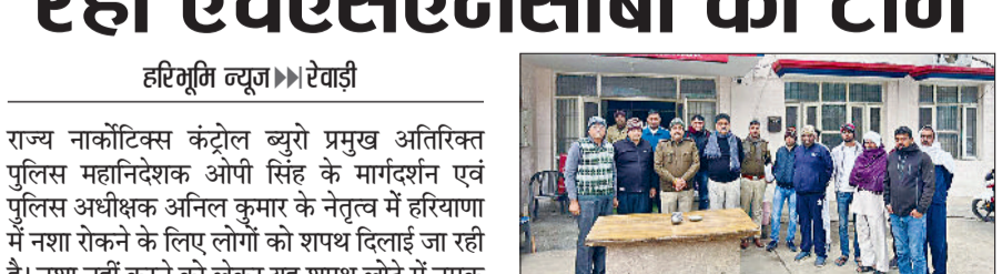
रेवाड़ी। कार्यक्रम में मौजूद नाकोटिक्स कंट्रोल ब्यूरो टीम व ग्रामीण।