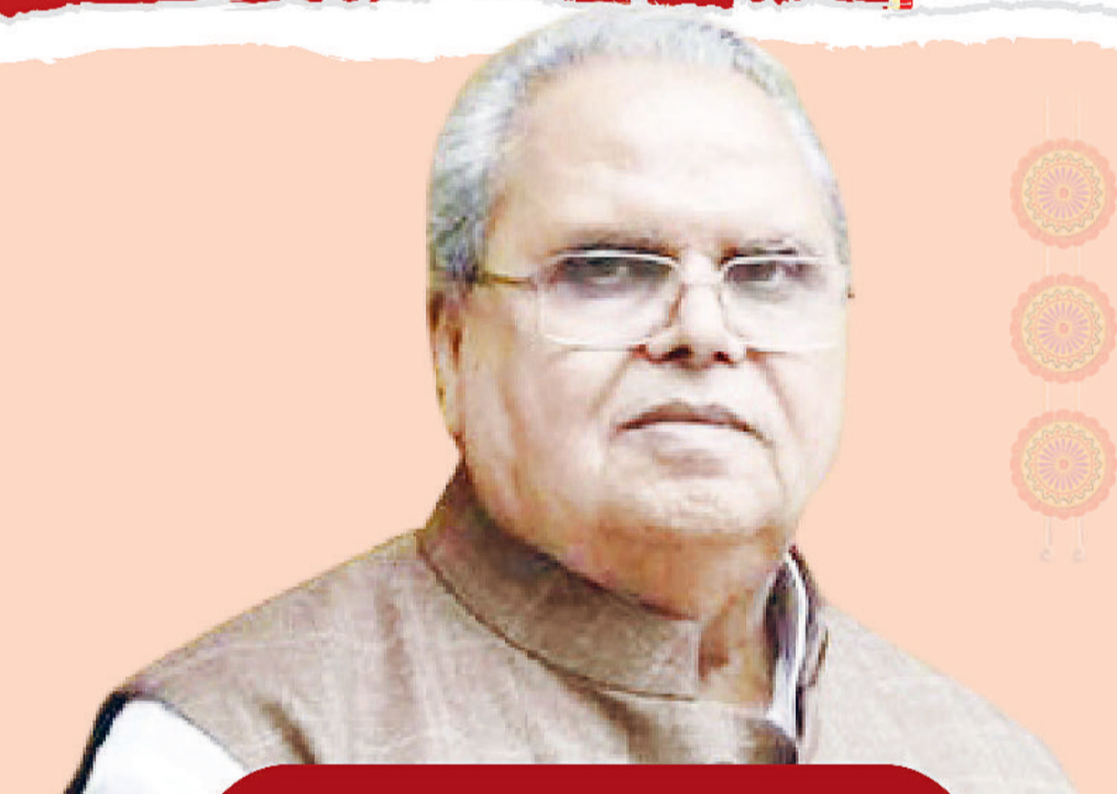
मुख्यातिथि माननीय श्री सत्य पाल सिंह मलिक प्रसिद्ध भारतीय राजनीतिज्ञ एवं पूर्व राज्यपाल- जम्मू कश्मीर, गोवा, बिहार एवं मेघालय