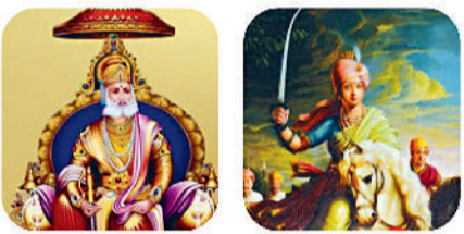
महाराज अग्रसेन रानी लक्ष्मीबाई