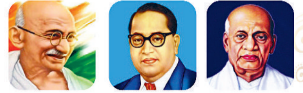
महात्मा गांधी डॉ. भीमराव अम्बेडकर सरदार वल्लभभाई पटेल

स्थान: नई अनाज मंडी, चरखी दादरी प्रीतिभोज : प्रातः 11:00 बजे से