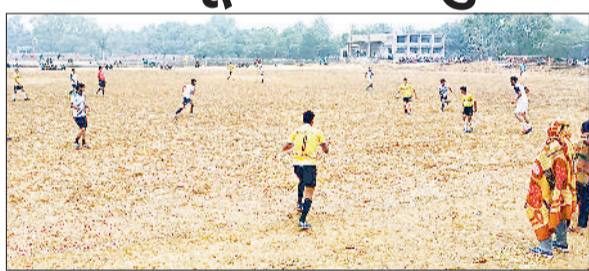
नारनौल। फुटबॉल प्रतियोगिता में भाग लेते खिलाड़ी।