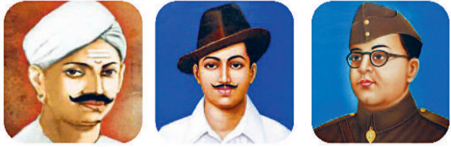
मंगलपाण्डे शहीद भगत सिंह सुभाष चन्द्र बोस